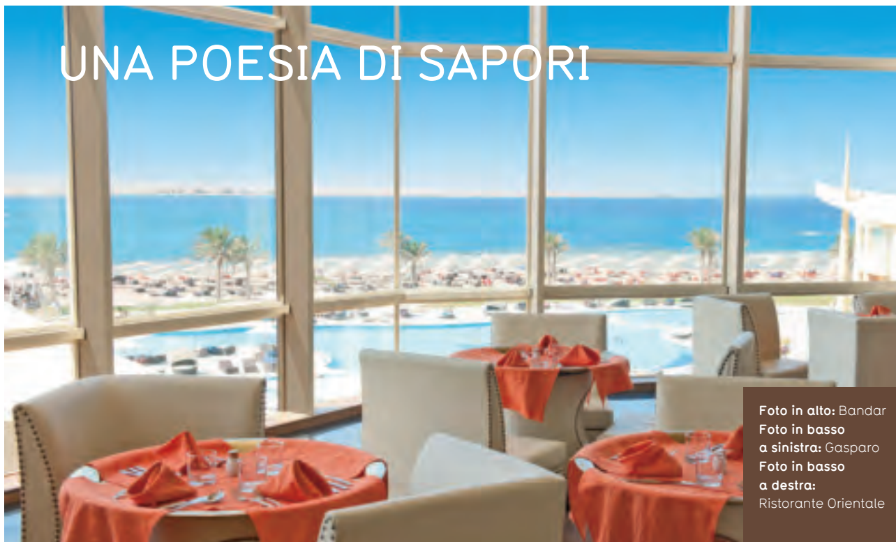
Foto in alto: Bandar Foto in basso a sinistra: Gasparo Foto in basso a destra: Ristorante Orientale